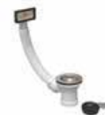
Válvula con rebosadero de 70 mm. (69020)