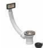
Válvula con rebosadero de 70 mm. (69020)